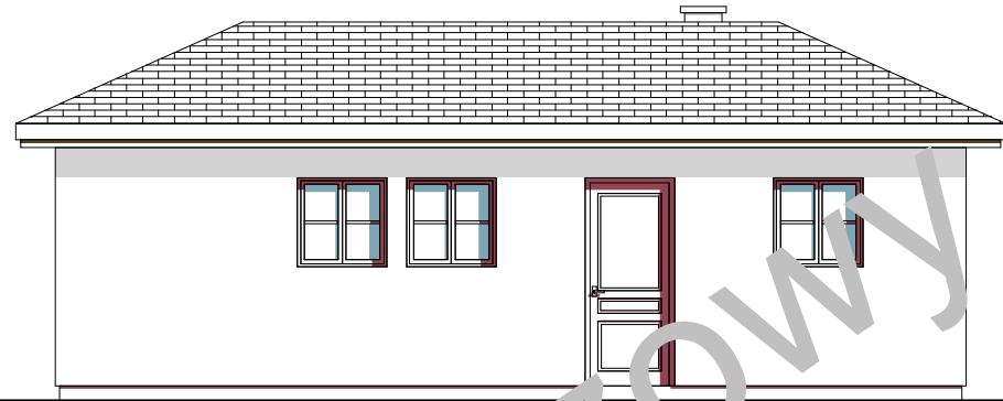
elevacja boczna :