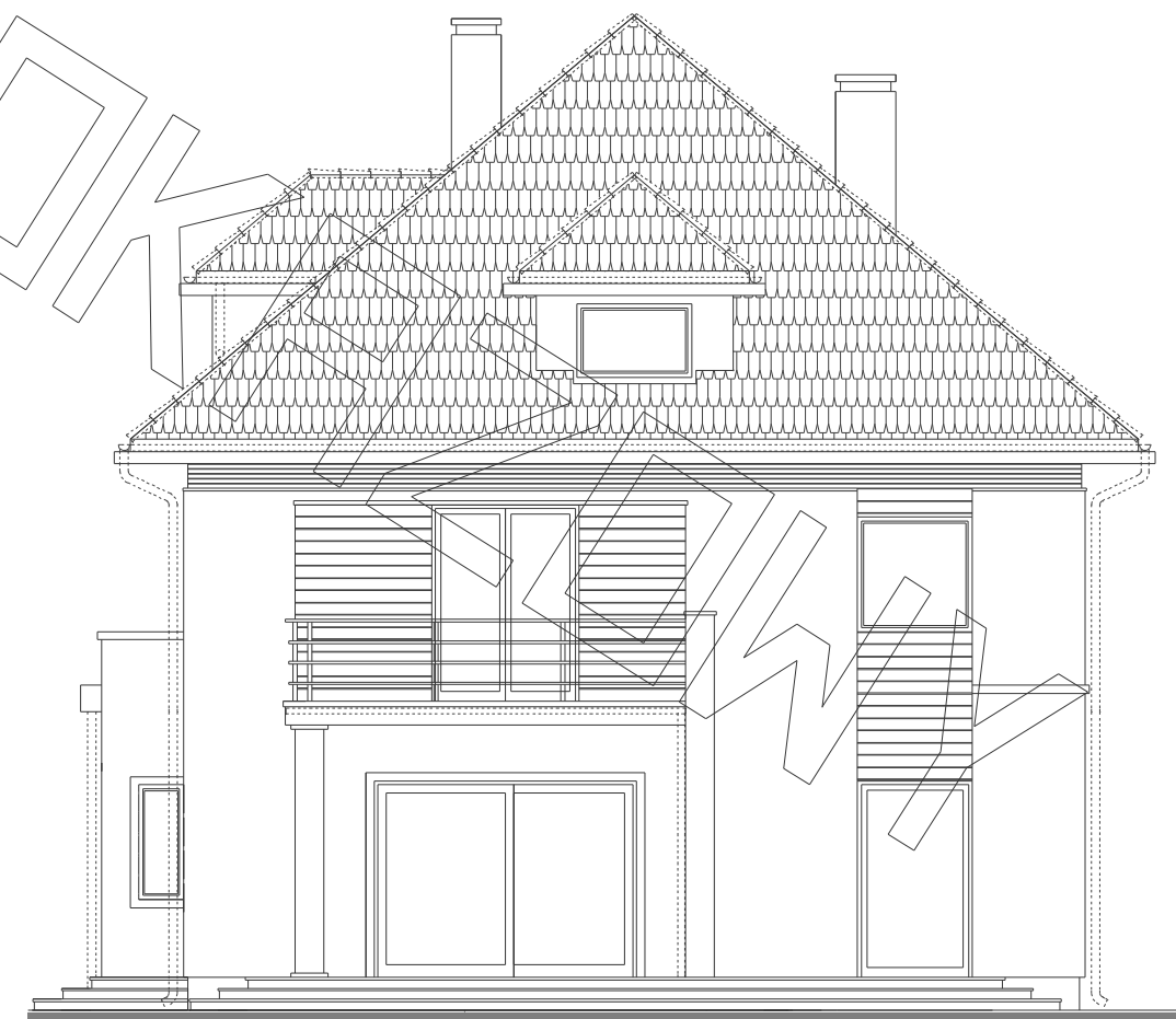
Elewacja tylna (ogrodowa) :