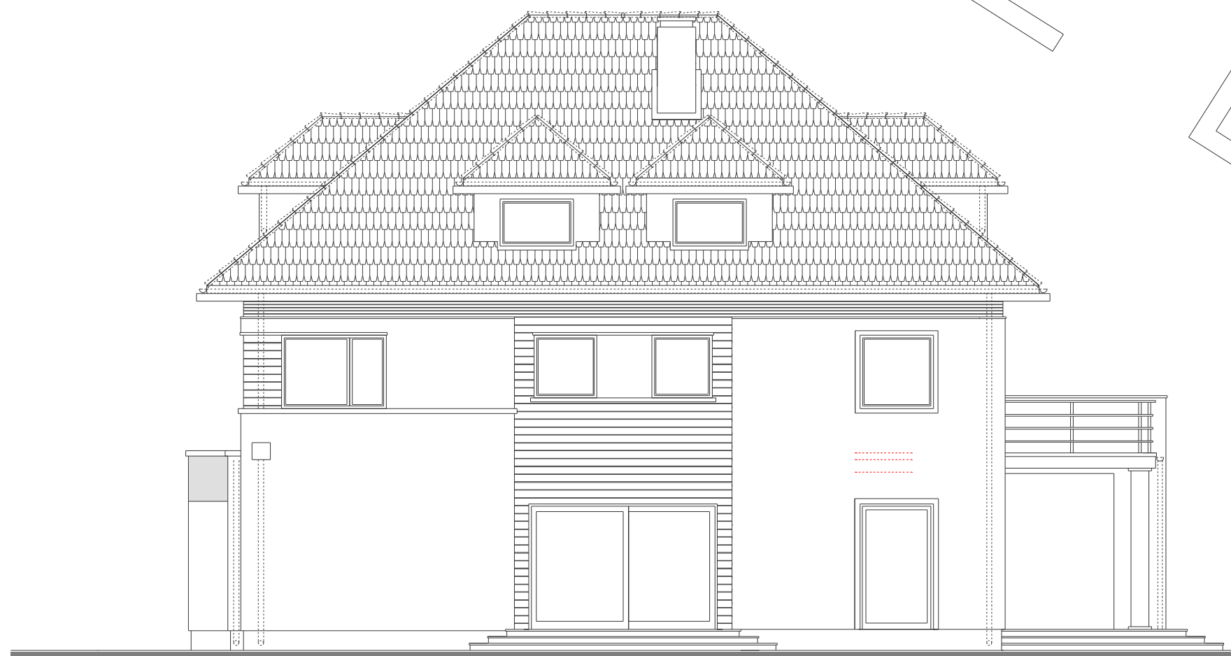
Elewacja boczna :