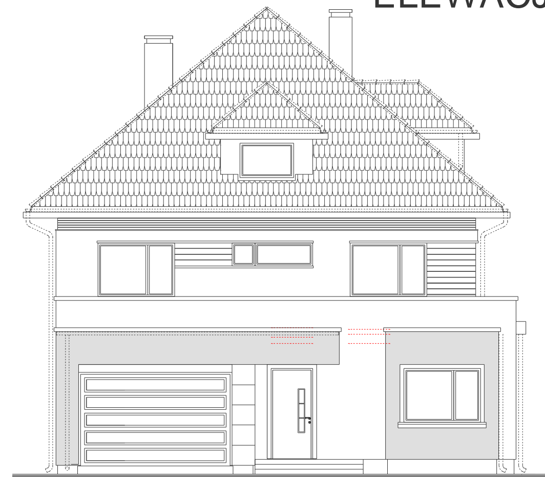
Elewacja frontowa :