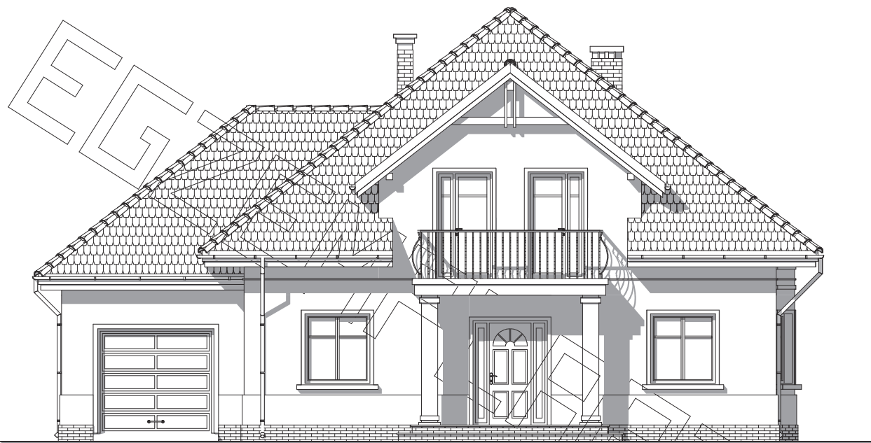
elewacja frontowa :