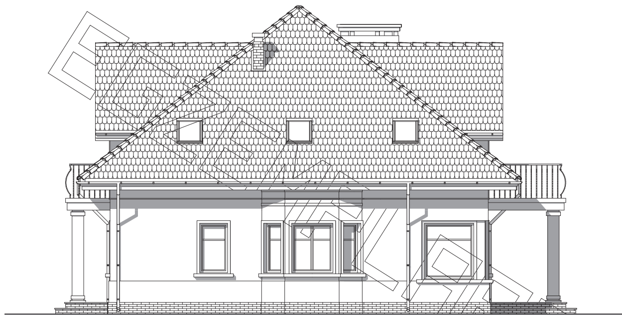
elewacja boczna :