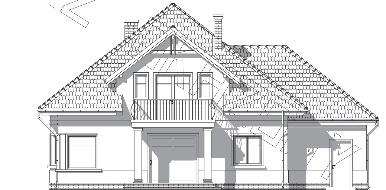
elewacja ogrodowa :