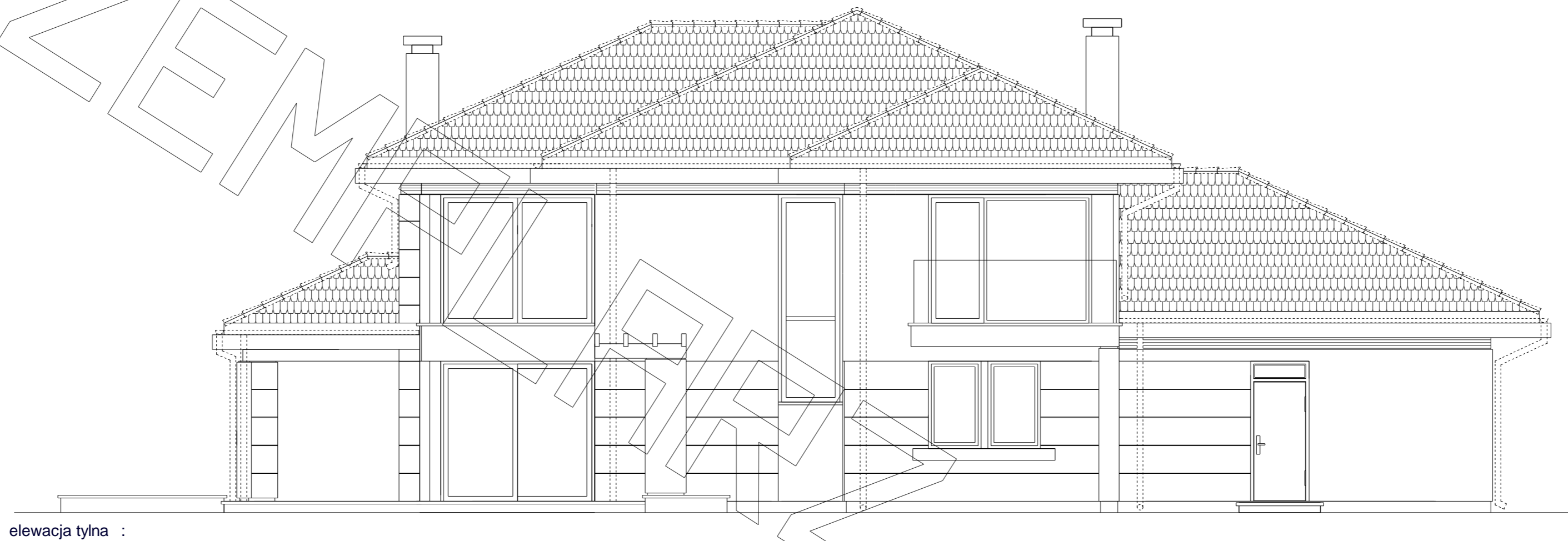
elewacja tylna :