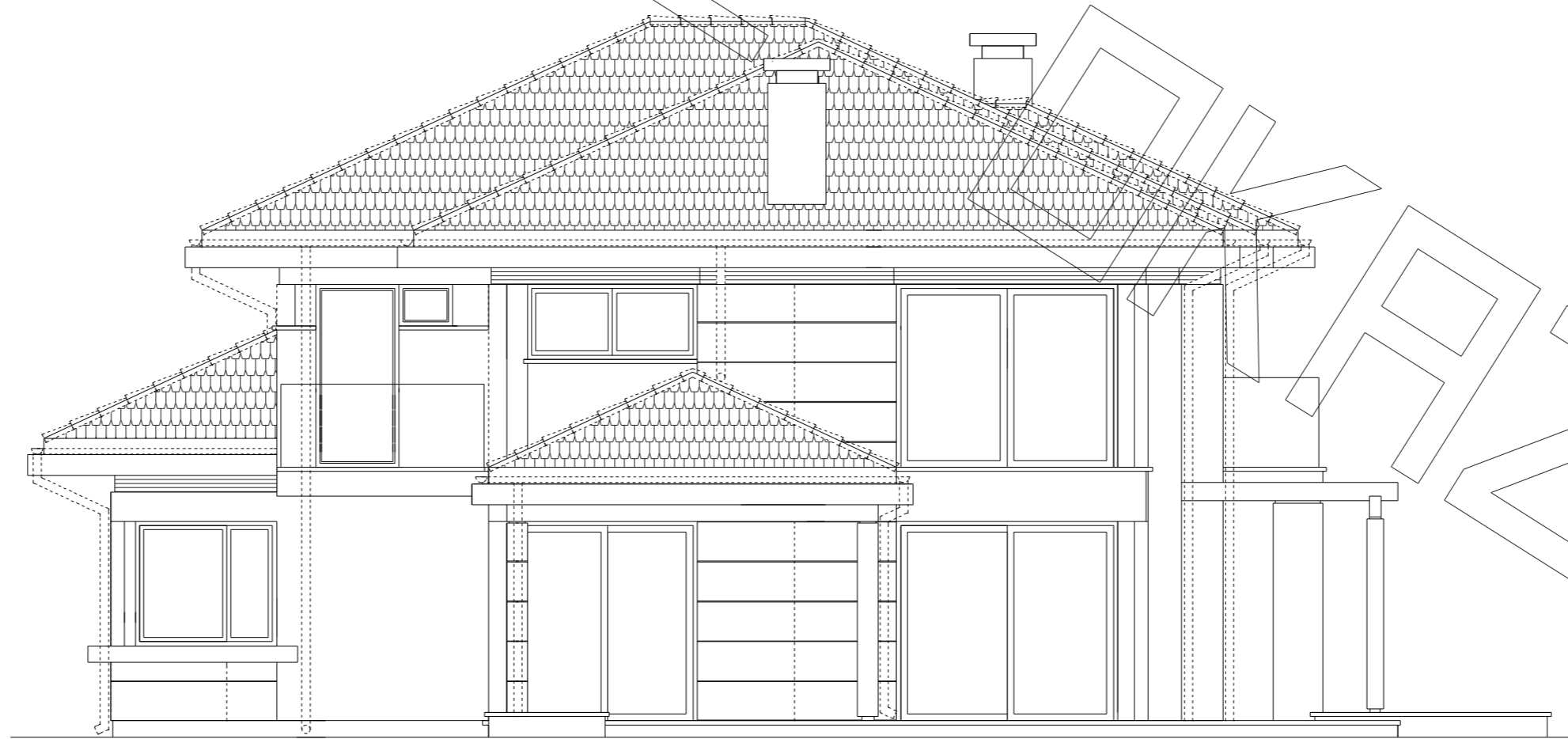
elewacja boczna :