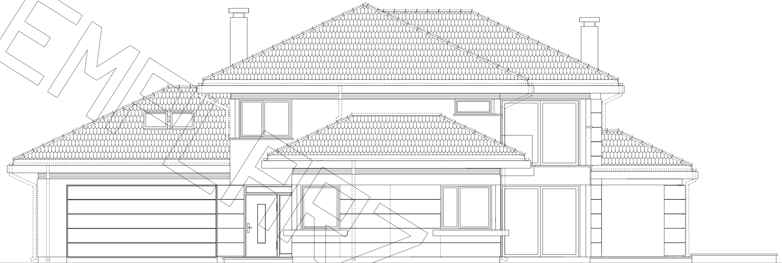
elewacja frontowa :