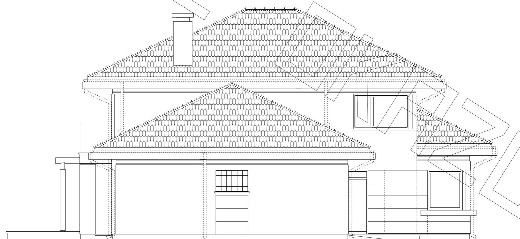
elewacja boczna :