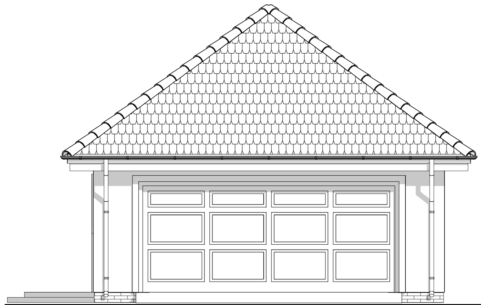
ELEWACJA FRONTOWA :