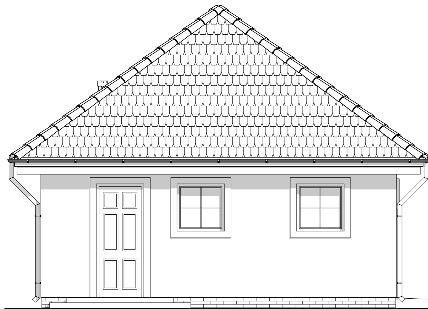
ELEWACJA BOCZNA :