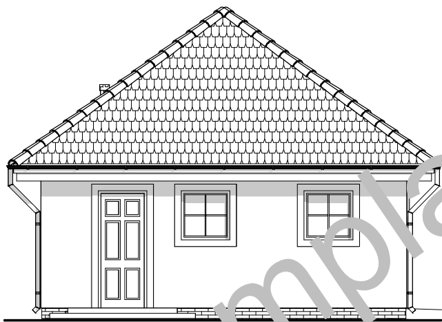
ELEWACJA BOCZNA :