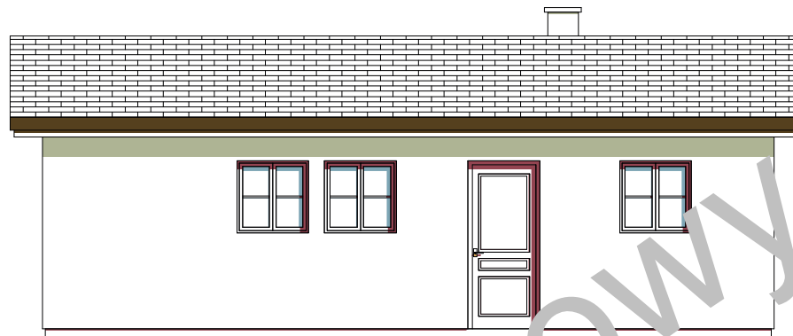
elewacja boczna :